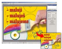
Tisk obalů pro CD :