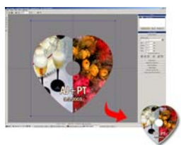
Tisk na CD "srdce":