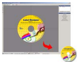
Tisk na CD 80 mm: