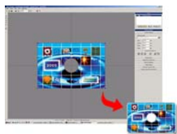
Tisk na CD "vizitka":