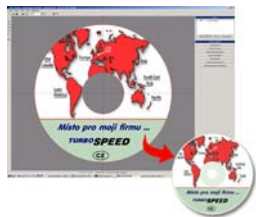
Tisk na CD 120 mm: